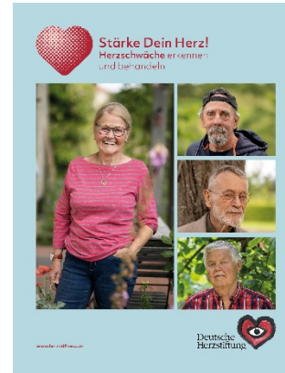
Titel der Herzwochen-Begleitbroschüre der Deutschen Herzstiftung

Kostenfreies Bildmaterial erhalten Sie bei der Pressestelle unter presse@herzstiftung.de